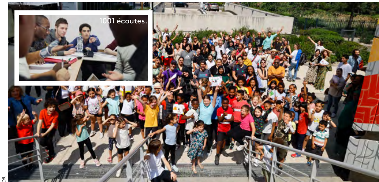
Le Grand bain.